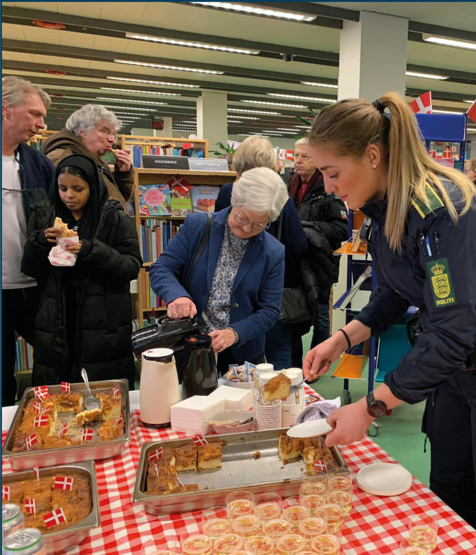
Vollsmose Biblioteks 50 års fødselsdag Vollsmose Bibliotek