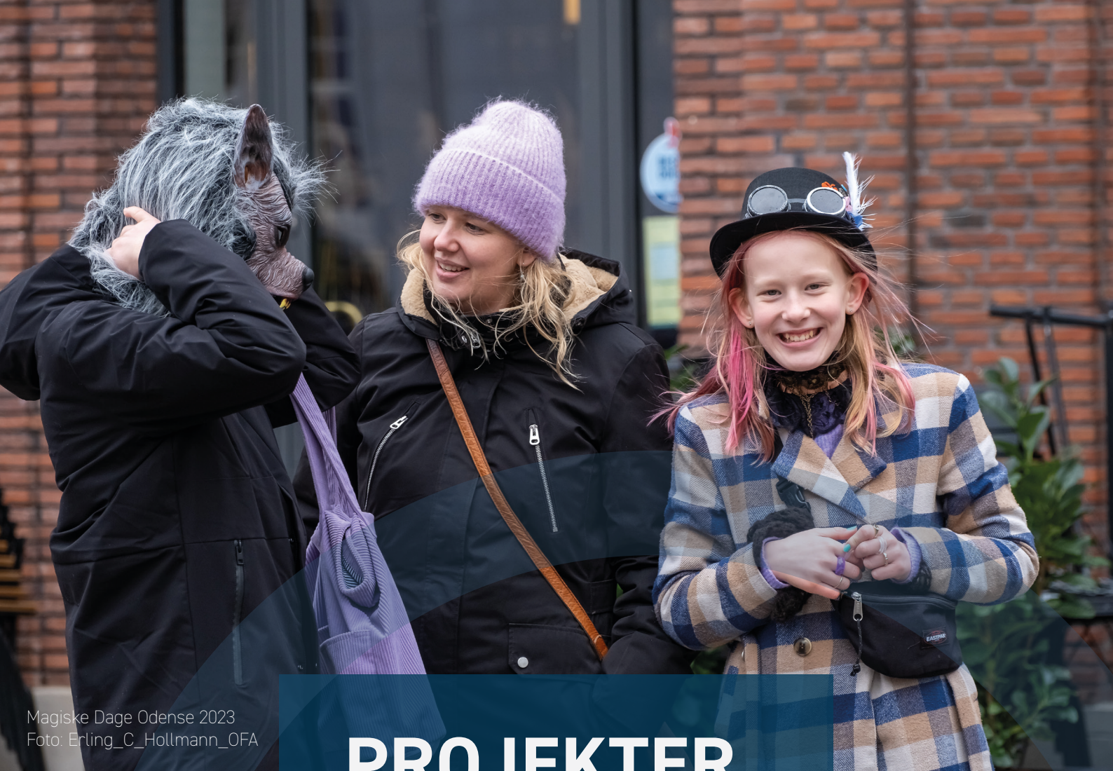
Magiske Dage Odense 2023