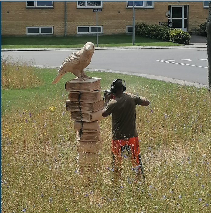
Træskulptur i den vilde have Tarup Bibliotek