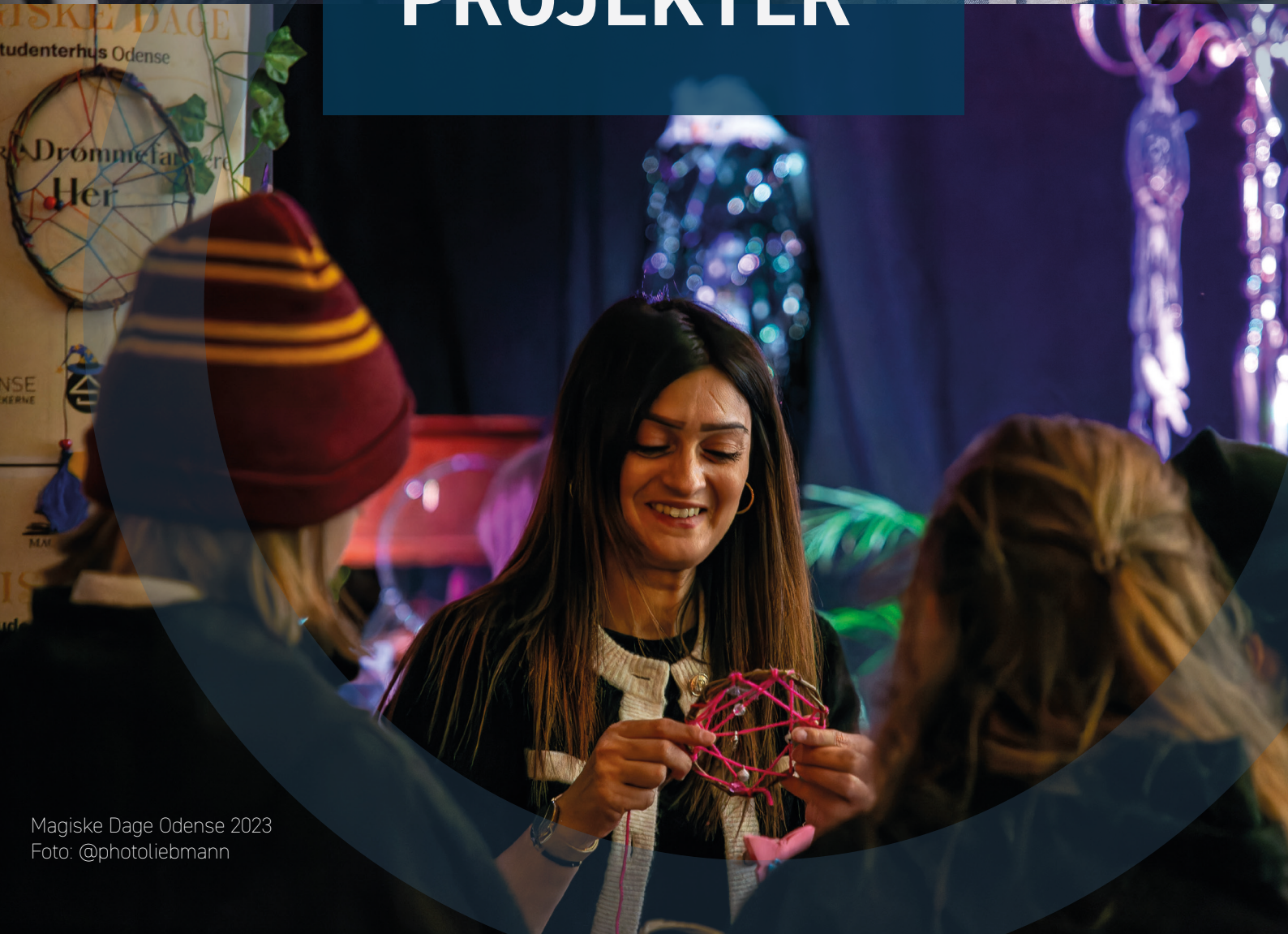
Magiske Dage Odense 2023