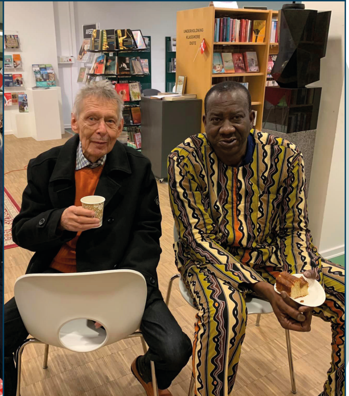
Vollsmose Biblioteks 50 års fødselsdag Vollsmose Bibliotek